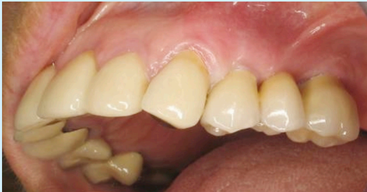
පෙර පිටුවේ සිටින රෝගියාම වුවත්, මෙහි සිටිනුයේ බොරු දත් සමඟය.