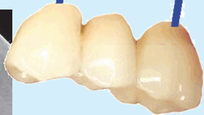
සවිකිරීම් දෙකකට ඒකක තුනකින් යුත් බොරු දත් සම්බන්ධ කළ හැකිය.