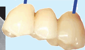
یو دری - شاخیزه پل د دوه ایمپلینټونو تر منځ لږول کیري.