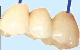
သွားကပ်တွဲသုံးခုကို သွားမြစ်တုနှစ်ခုတွင်တွဲကပ်နိုင်သည်။