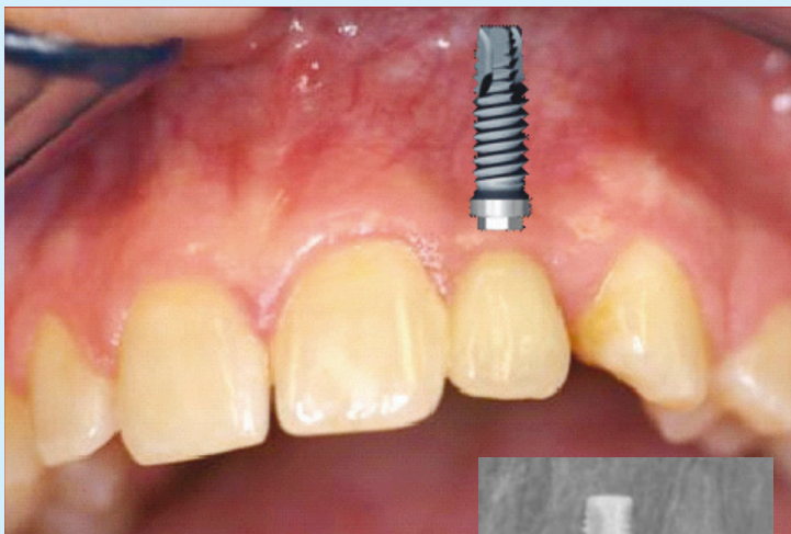
X-ray ဓါတ်မှန်နှင့်အပေါ်ဓါတ်ပုံတို့သည် လူနာချင်းတူသည်။ သွားမြစ်တုပုံကို အပေါ်မှထပ်ထားသည်။

သွားမြစ်တုတပ်ဆင်ခြင်းသည်များစွာသောလူများအတွက်သင့်တော်သောကောင်းမွန်စွာတည်ဆောက်ထားသည့် လုပ်ငန်းစဉ်တစ်ခုဖြစ်သည်။ လူအများအပြားသွားမြစ်တုကိုအသုံးပြုနိုင်သည်။ သို့သော်ကိစ္စအနည်းစုမှာသွားဖုံးရိုး မလုံလောက်၍ဖြစ်နိုင်သည်။ သို့မဟုတ်သူတို့ကျန်းမာရေးအခြေအနေတစ်ခု ရှိနိုင်သည်။ သို့မဟုတ် ရွေးချယ်မှုကန့်သတ်ထားသည့် ဆေးဝါးများသောက်သုံးနေခြင်းလည်းဖြစ်နိုင်သည်။ ဆေးရွက်ကြီးသောက်သုံးသူများသည် သွားမြစ်တုများကိုချောင်သွားစေပြီး ဖယ်ထုတ်ပစ်ရသည်အထိအလွန်