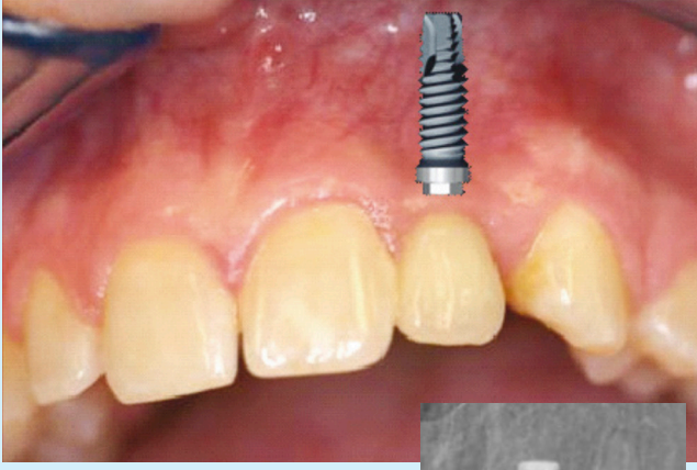
صورة الأشعة السينية (X-ray) والصورة أعلاه هما لنفس المريض، مع صورة الجذر المزروع الذي تم تركيبه.

يتم استخدام زرع الأسنان لتوضع أسنان بدلاً من الأسنان التي تم فقدانها. يقدم هذا الكتيب معلومات حول زرع الأسنان.